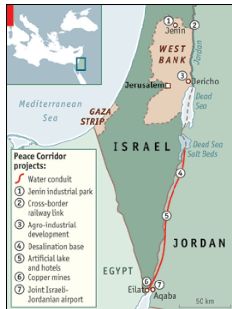
Le projet « Red-Dead conduct »

environnementales d'un tel projet. Sa construction pourrait en effet endommager les récifs de coraux de la mer Rouge, un secteur qui attire beaucoup de touristes chaque année. De plus, on craint une potentielle contamination des nappes phréatiques par l'eau de mer ainsi transportée sur des centaines de kilomètres.